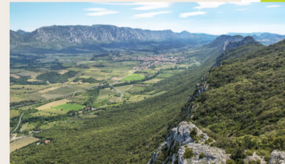
Le synclinal de St-Paul-de-Fenouillet vue depuis les crêtes

nantes falaises. Nous nous trouvons aussi sur l'épicentre des séismes nord-pyrénéens, les dernières fortes secousses datent de 1996 et 2004.