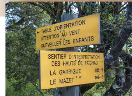
La signalétique de l'itinéraire

Pensez à réserver ! Retrouvez toutes les offres sur www.tourisme-pyreneesorientales.com Rubrique « organiser votre séjour » - « Où dormir ? » Informations réservations meublés de tourisme : Gîtes de France des Pyrénées-Orientales 33 (0)4 68 68 42 88 www.gites-de-France-66.com Clévacances des Pyrénées-Orientales 33 (0)4 68 51 52 53 www.tourisme-pyreneesorientales.com